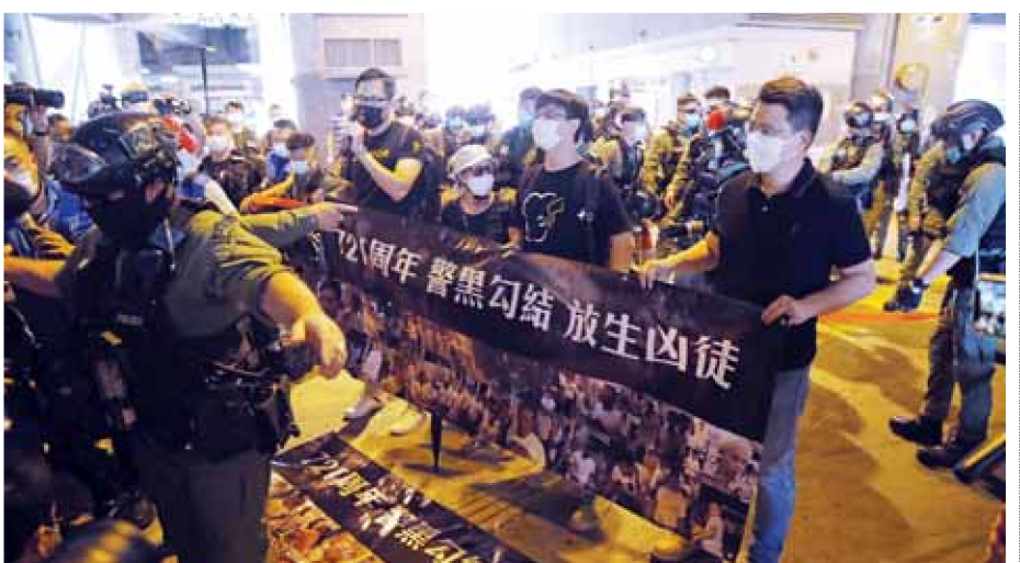
Riot police stand guard as pro-democracy protesters hold a news conference to mark one-year anniversary of the Yuen Long subway attack at the subway station in Hong Kong on Tuesday