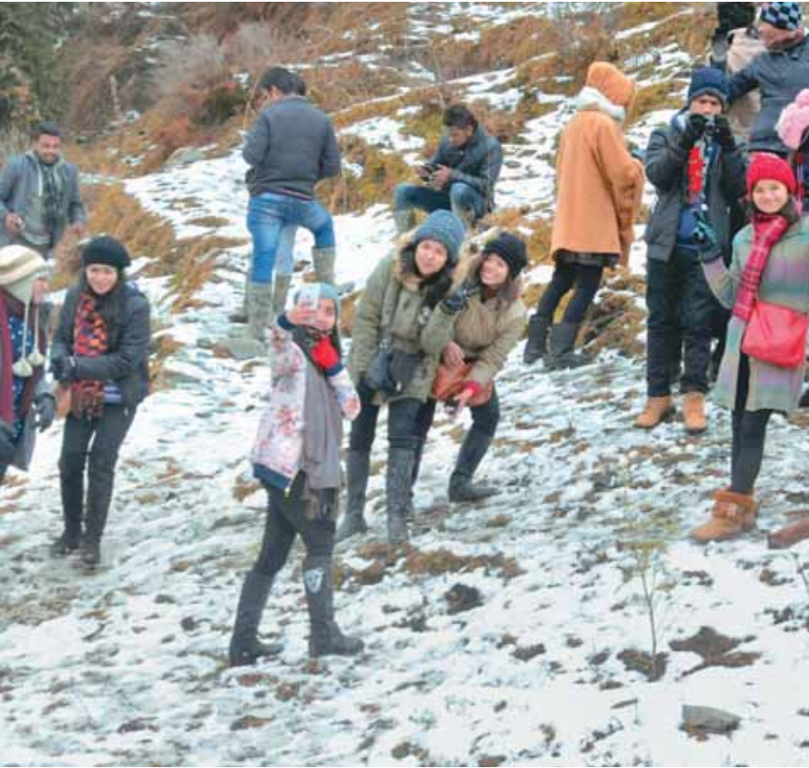
शिमला में महापू चोटी पर बर्फबारी का आनन्द लेते पर्यटक

दाखिल करेंगे। पीठ ने कहा, हरियाणा, उत्तर प्रदेश और राजस्थान ने स्वेच्छ से हलफनामे दाखिल करके इस तथ्य को हटाने की बात कही है कि 24 अक्टूबर का आदेश इन राज्यों को नोटिस दिए बगैर ही पारित किया गया था। पीठ ने इसके साथ ही उन्हें दो सप्ताह के भीतर हलफनामे दाखिल करने का निर्देश दिया। पीठ ने टिप्पणी की कि जब उसने 24 अक्टूबर को इन राज्यों में एक नवंबर से पेट कोक और फर्नेस आर्यल के उपयोग पर प्रतिबंध लगाने का आदेश दिया था तो उत्तर प्रदेश और राजस्थान की ओर से कोई भी वकील पेश नहीं हुआ था। शीर्ष अदालत ने 24 अक्टूबर के अपने आदेश में यह भी लिखा था, उत्तर प्रदेश और न ही राजस्थान की ओर से कोई प्रतिनिधि उपस्थित है। हरियाणा की ओर से पेश वकील ने हमसे दो मिम्ट प्रतीक्षा करने का अनुरोध किया ताकि राज्य सरकार से निर्देश प्राप्त किया जा सके।